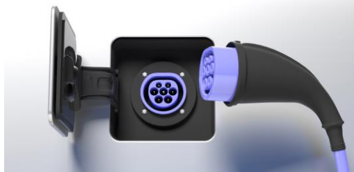
Typ 2-kontakt och uttag

Svar: En fast sladd vid laddplatsen är bekvämt för bilägaren. Om det är olika bilägare som kommer att använda laddplatsen är det bättre om var och en har med sin sladd som passar bilens uttag. Fasta sladdar innebär fler saker som kan gå sönder och om laddaren är monterad där allmänheten passerar bör man tänka på risken för skadegörelse. En sladd följer med elbilen vid köpet. Ofta har elbilsägaren ett par olika sladdar i bilen, en för daglig laddning (Typ 2), t ex under natten, och en för tillfälliga laddningar (vanlig schucko-kontakt för jordat uttag, att betrakta som en reservtank).